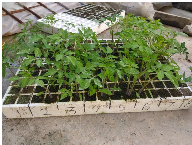
Imagen 5. Plantel con las variedades de tomates donadas a Perdro de Beniel. Los números corresponden :1-Bombilla, 2-Negro, 3-Negro de Yeste, 4- Ceheginero, 5-Flor de Baladre, 6-Aprunado, 7 y 8- Muchamiel.

Cada fila son 10 alveolos, por los que se plantaron 20 alveolos por variedad.