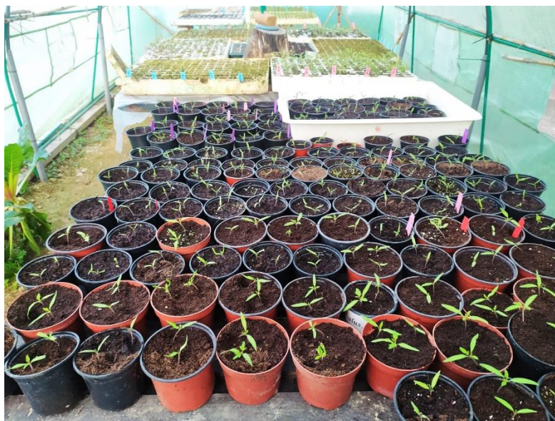
Imagen 4. Semilleros de Francisco García, realizado con las semillas donadas.