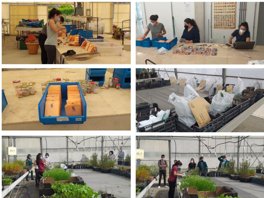
Imagen 6. Preparación y donación de semillas y plantel a centros educativos