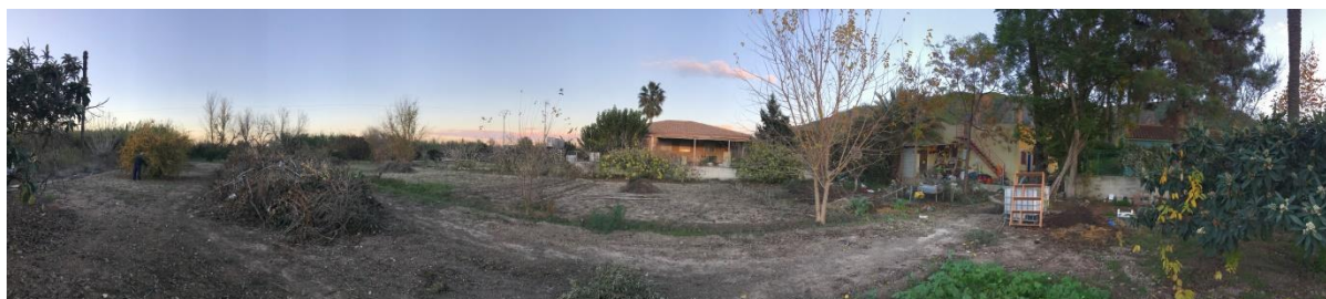
Imagen 2. Parcela de Mariano, donde se ha realizado el cultivo